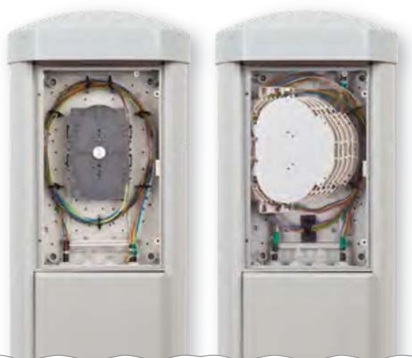
SNM 48 SIS