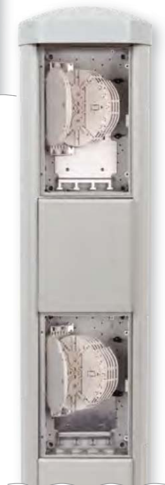
SNM 144 VS SIS