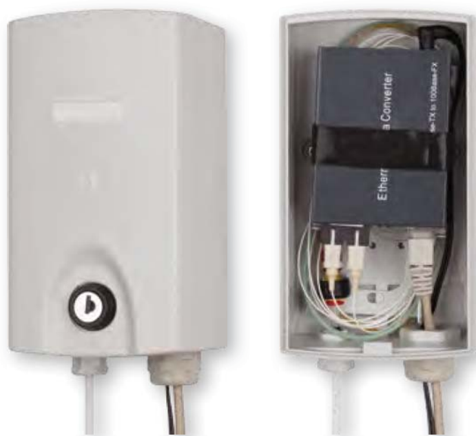
MEDIA BOX PLASTIC